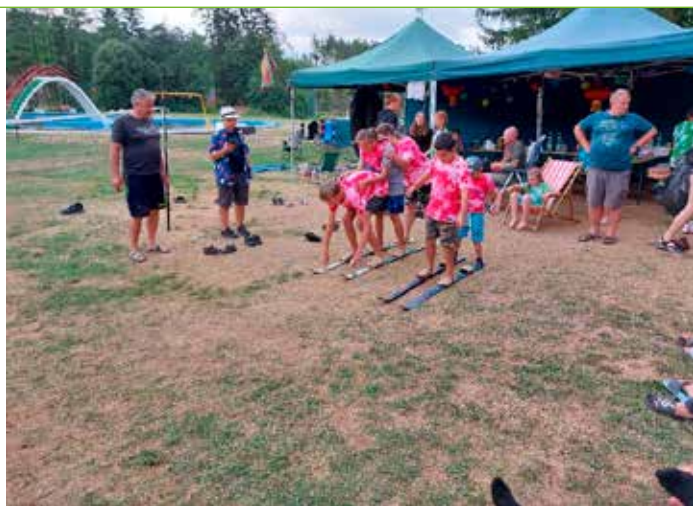
Předposlední sportovní disciplína - týmový běh na lyžích. Dva páry lyží a úkol přemístit všechny členy družstva na druhý konec prostranství. Uprostřed připravena šikana. Ukázalo se, jak jsou jednotlivá družstva sebraná a také různá taktika.