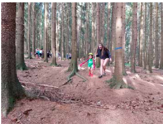
Sportovní disciplína slalom. V originále se sjíždí kopec a kličkuje se mezi slalomovými brankami. Bohužel kůrovec lesy v okolí tábora poněkud zdevastoval. A tak jsme vytýčili okruh. Povinná výbava - přilba, lyžařské brýle, zimní rukavice a hůlky. Nejmenším pomáhali vedoucí.