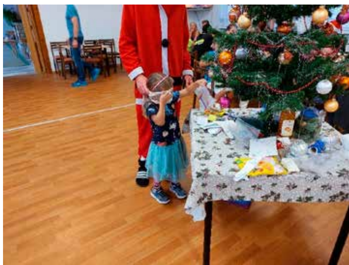
Po štědrovečerní večeři si již děti docházely pro dárečky. Oči zavázané a výběr dárku pouze pohmatem.