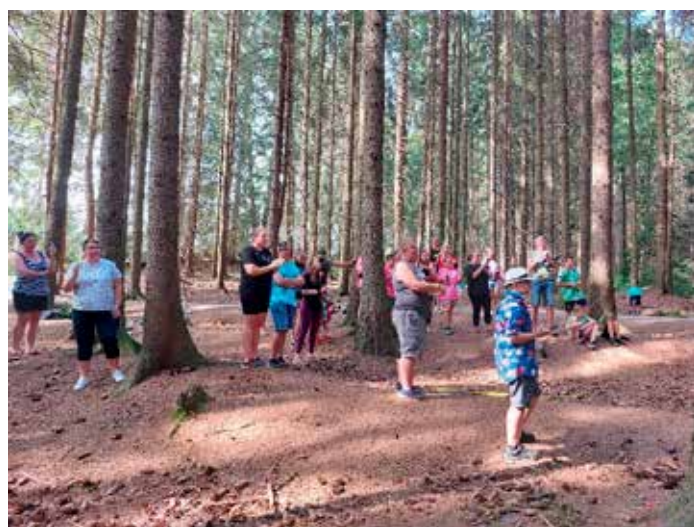
Opět fandící publikum. Nejen rodiče, ale i závodníci povzbuzovali své kamarády. Chvillemi to bylo tak hlasité, že veverky a ostatní zvířátka emigrovala do nejbližšího klidného velkoměsta.