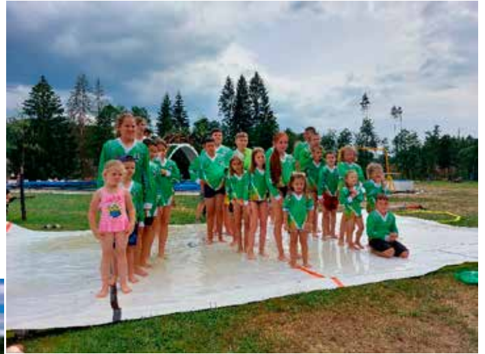
Nástup soutěžních týmů před hokejovým turnajem

Zimní olympijské hry bývají zpravidla uprostřed zimy. A k zimě patří Vánoce. Na našem táboře jsme si je připomněli hned několikrát. Tou první připomínkou bylo hledání rozinek ve vánočkách. Každý tým dostal vánočku a v každé bylo zapečeno 24 hrozeček. Děti dostaly za úkol všechny hrozečky vypreparovat a sdělit jejich počet. Druhým vánočním úkolem pak byla výroba bramborového salátu. Jedinou ingrediencí, kterou děti od nás obdržely byly majonézy. Vše ostatní si musely obstarat samy. A také rozdělát oheň, na kterém pak brambory a ostatní zeleninu uvařily. Na úplný konec tábora jsme pak měli i štědrovečerní večeri, kde nám hrály koledy a děti dostaly dárky.