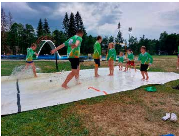
K zimním olympijským hrám patří také krasobruslení. V originále maximálně taneční páry, v našem pojetí to byly skupiny 7 dětí. Úkol - vymyslet a předvést taneční kreaci na "ledě" v trvání 2 minuty.