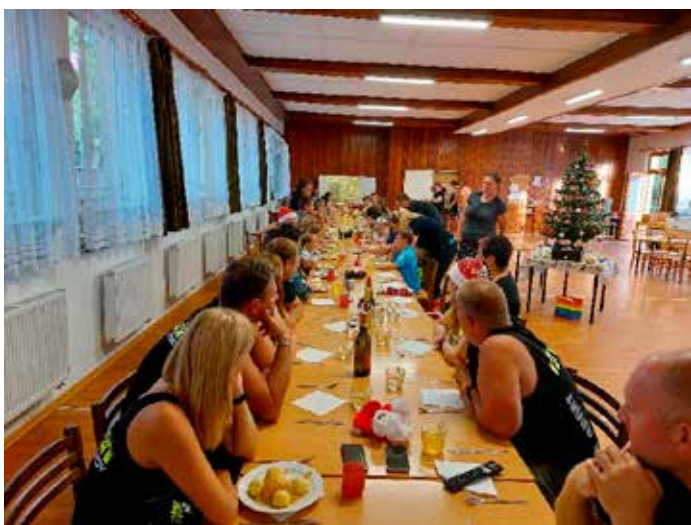
Vánoční tabule - v pátek večer jsme mohli přeuspořádat jídelnu a sestavit tabuli pro 55 lidí. K tomu vánoční stromeček. Jen místo kapra a salátu jsme dostali plněné bramborové knedlíky. Chutnaly skvěle.