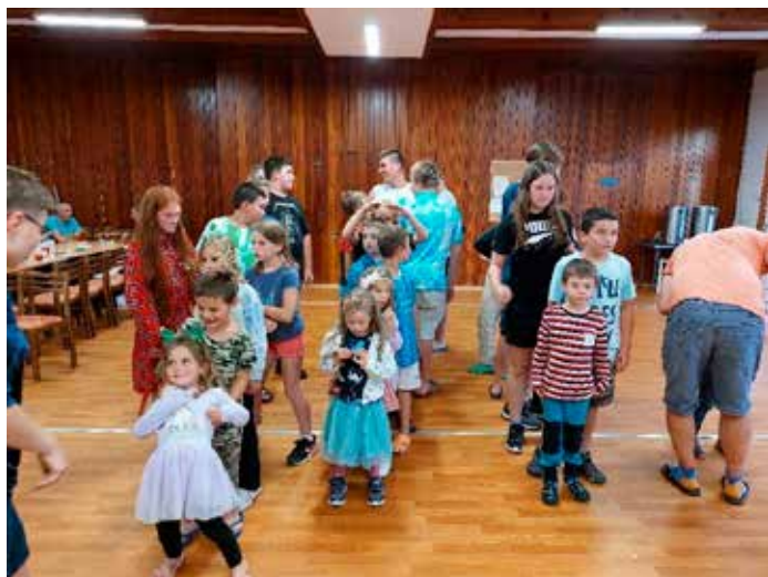
Nakonec vyhlášení výsledků celotáborové hry.

Tábor Racků 2023 je za námi. Bylo to úžasný týden strávený v krásném prostředí se skvělými dětmi a dospěláky. Všichni jsme si jej užili a už se těšíme na další rok. Dokonce se podařilo zamluvit větší ubytovací kapacitu. Patří se poděkovat všem trenérům, vedoucím a dospělákům, kteří se na přípravě a zdanu tábora podíleli.