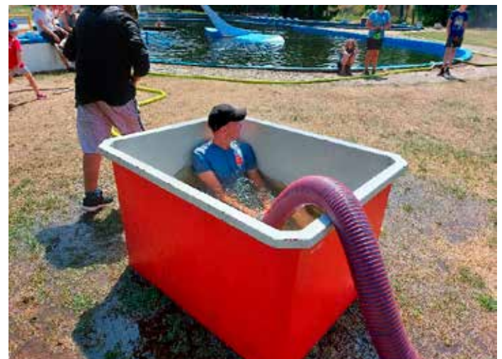
I letos náš tábor provázely vysoké teploty, takže osvěžení na 100 způsobů