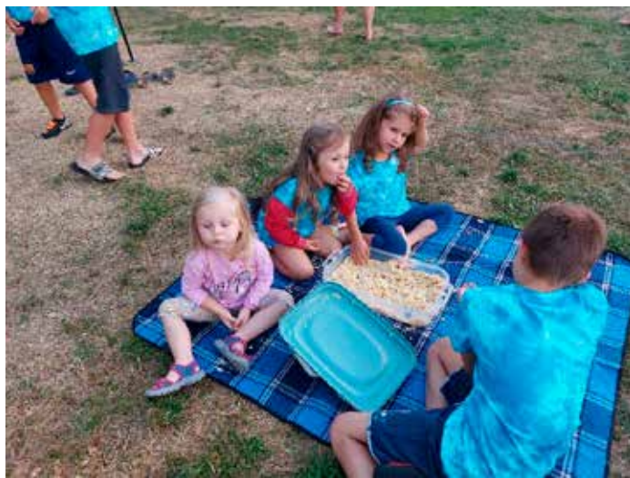
Tak vypadá vánočka po preparaci, jejím účelem bylo vyhledat všechny zapečené rozinky. Zapojily se všechny děti a některé zbytky vánočky se hodily i ve večerních hodinách.