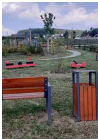
...u nás posekáno