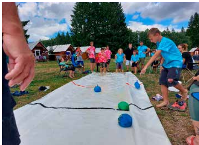
Curling v podání Hýskovských hasičů. Plachta, kterou jsme již použili na hokej a krasobruslení byla zúžená a místo curlingových kamenů jsme použili nafukovací balóčky naplněné vodou. Hned po několika úvodních pokusech děti pochopily nezbytnost taktického uvažování.