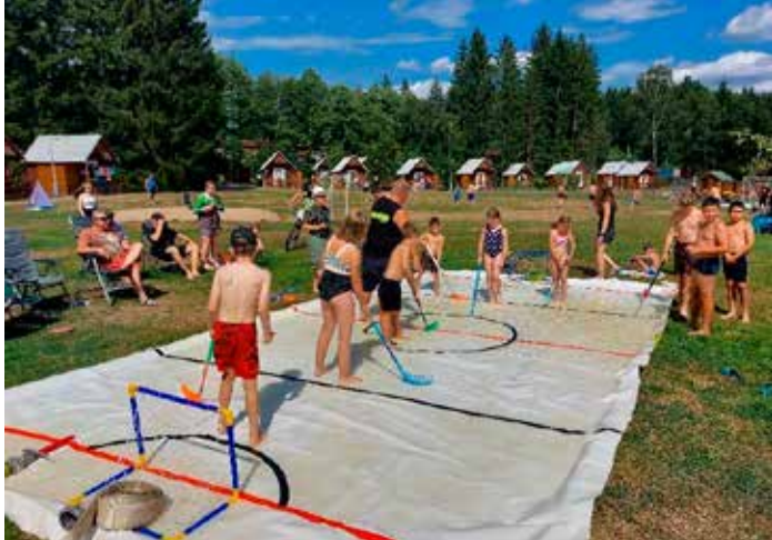
Soutěžní hokejové klání pod širým nebem v červenci

Doba prázdnin bývá poněkud chudší na sportovní akce, ale současně je také příležitostí pro netradiční zážitky. Hýskovští hasiči pořádají už více než 10 let prázdninový tábor pro děti. Letos vyšel termín našeho tábora na týden od 22. července 2023 a již po šesté jsme zavítali do areálu RSA Horní Bradlo – kousek od vodní nádrže Seč. Přípravy začaly ihned po skončení nočních závodů, o kterých jsme psali v minulém čísle Hýskováčku. Každý náš tábor má dvě základní součásti. Tou první je dopolední nácvik hasičských dovedností, pro který máme v areálu optimální podmínky, včetně dostatečného zdroje vody na požární útoky z okolo tekoucí řeky Chrudimky.