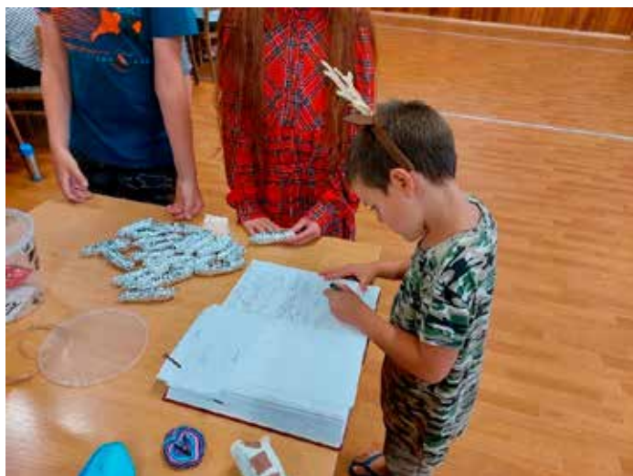
A také nezbytný zápis do kroniky.