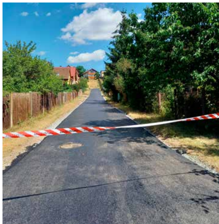
Pěšina u Berounské ulice