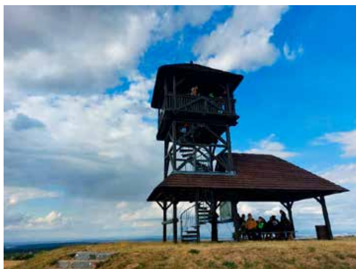
Střední výlet jsme zakončili výstupem na dřevěnou rozhlednu Boika u Českých Lhotic. Čekala nás krásná procházka z Nasavrku a pak výstup nahoru s výhledem do širokého okolí.