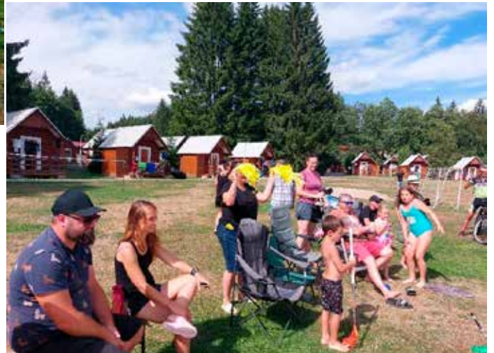
Ke každému sportovnímu klání patří diváci a roztleskávačky

Druhou stěžejní částí je celotáborová hra. Již jsme vyzkoušeli mnoho témat a je velice obtížné najít něco nového. Nicméně asi se nám to opět povedlo. Námět uspořádat zimní olympijské hry v červenci byl nejen originální, ale také umožnil velmi nezvyklé a zábavné činnosti. A tak letošní tábor provázelo také netradiční sportování.