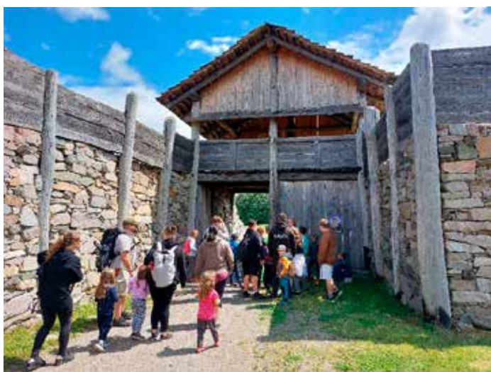
Pravidelný střední výlet - skanzen Země keltů u Nasavrku. Mohli jsme se přenést několik tisíciletí nazpět a poznávat jak se v té době žilo. Velice dobře pojatá prohlídka, kde umožnili dětem také si zastřílet z luků nebo vyzkoušet historické soubory měkkými zbraněmi. Hodně času děti strávily též u výběhu dospělých prasat a selátek.