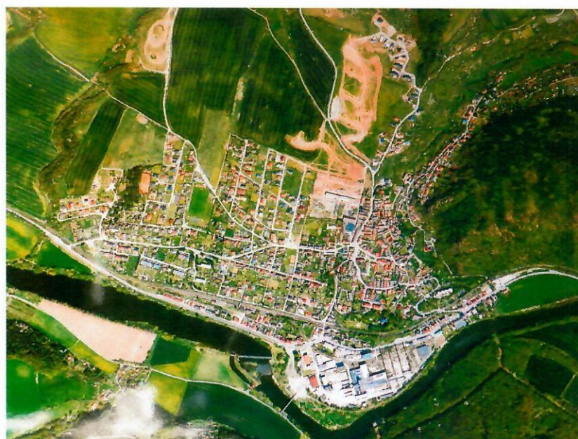
letecký pohled Hýskov