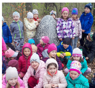
6 Mateřská škola Ledňáček