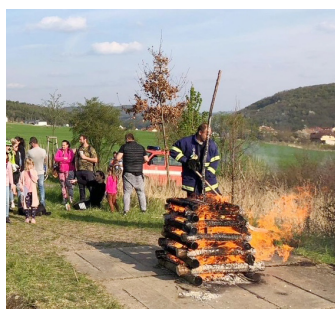
4 Pálení čarodějnic