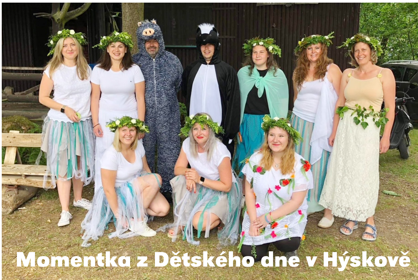
Momentka z Dětského dne v Hýskově