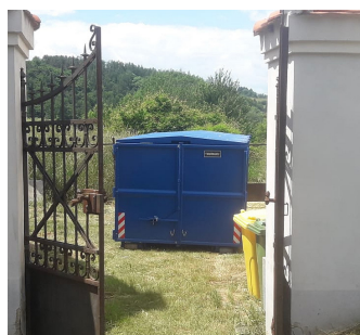
9 Nový kontejner na hřbitově