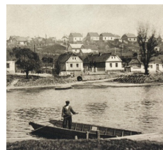
14 Z historie: Přívoz